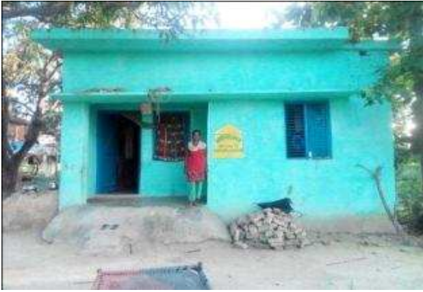
सगर बानो पत्नी अकरम अली