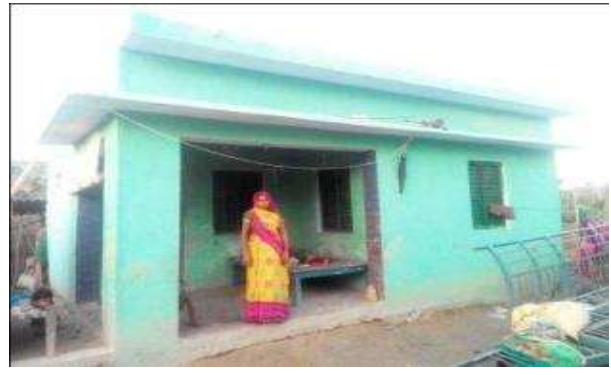
मोहना पत्नी रामवृक्ष