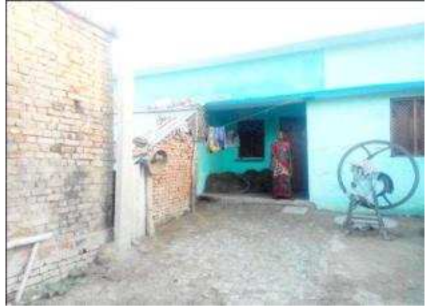
उषा देवी पत्नी गोविन्द लाल