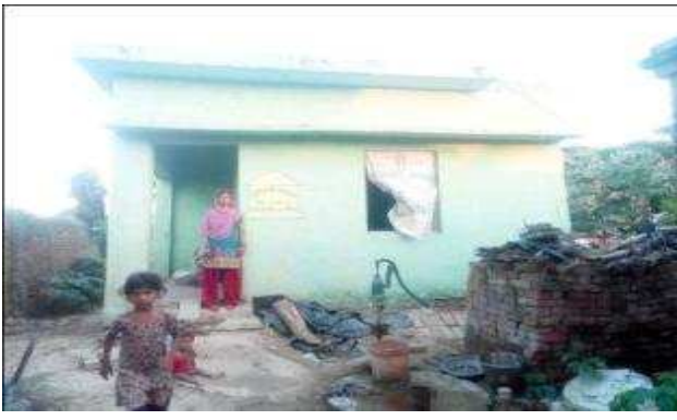
इसरासुन्निशा पत्नी हकीम