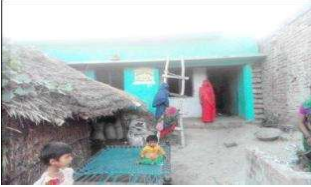
चिनकू पत्नी सोमई