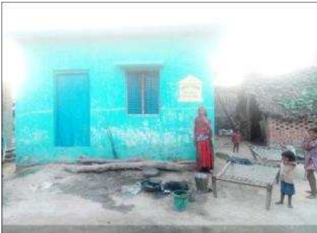
ननका पत्नी राजू