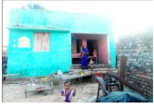
हनोमान पुत्र भगौती