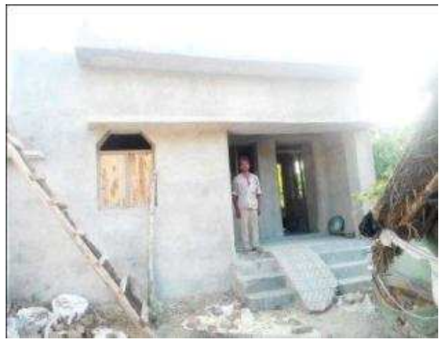
जंगली पुत्र बुद्ध