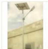
SOLAR LIGHT (16)