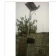
SOLAR LIGHT (7)