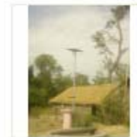
SOLAR LIGHT (19)