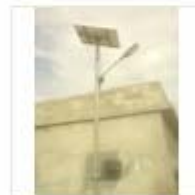
SOLAR LIGHT (17)