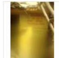
LOHIYA AWAS (4)