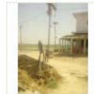
SOLAR LIGHT (12)