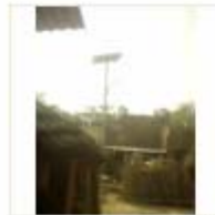
SOLAR LIGHT (21)