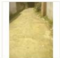
RCC ROAD (6)