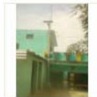
SOLAR LIGHT (15)