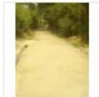
RCC ROAD (1)