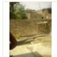
RCC ROAD (8)