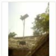
SOLAR LIGHT (14)