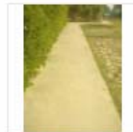
RCC ROAD (9)