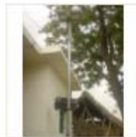
SOLAR LIGHT (3)