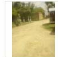
RCC ROAD (5)