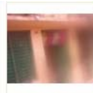
LOHIYA AWAS (5)