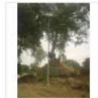
SOLAR LIGHT (23)