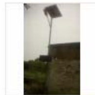
SOLAR LIGHT (5)