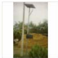
SOLAR LIGHT (4)