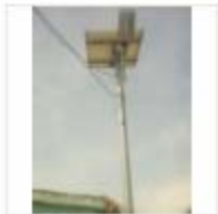
SOLAR LIGHT (20)