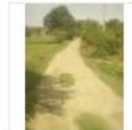
RCC ROAD (4)