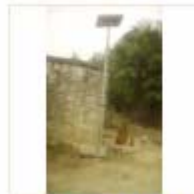
SOLAR LIGHT (9)