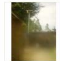
SOLAR LIGHT (18)