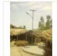
SOLAR LIGHT (11)