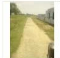
RCC ROAD (2)