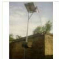
SOLAR LIGHT (22)