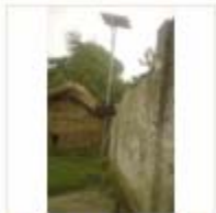
SOLAR LIGHT (8)