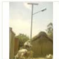
SOLAR LIGHT (10)