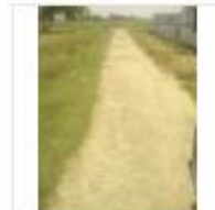
RCC ROAD (3)