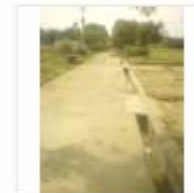
RCC ROAD (11)