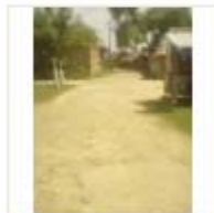
RCC ROAD (7)