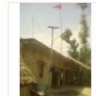
SOLAR LIGHT (13)