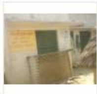
LOHIYA AWAS (7)