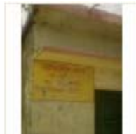
LOHIYA AWAS (2)