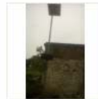
SOLAR LIGHT (6)