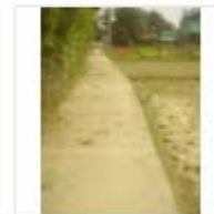
RCC ROAD (10)