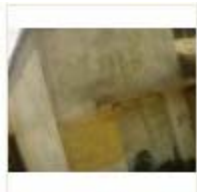
LOHIYA AWAS (1)