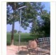
SOLAR LIGHT (2)