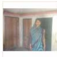
LOHIYA AWAS (3)